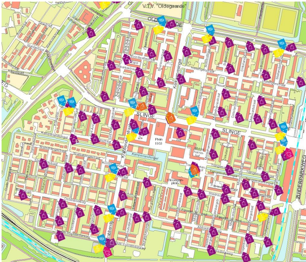
Afbeelding 3: locaties ondergrondse containers in Pendrecht 4

Ik word erg boos als ik vuil zie dat geplaatst is op of naast de container. Het duurt enige dagen voor de gemeente dit afval verwijdert. Afgelopen zomer was er veel stankoverlast. De gemeente schrijft een heleboel dingen waar ik niks mee te maken heb. Het gaat om mijn situatie en de gemeente verplaatst zich niet in mij. In de omgeving heb ik maar 1 vergelijkbare situatie aangetroffen en daar woonde een huurder van een particuliere woning. Aan de overkant is meer ruimte voor een container. Toen de gemeente daar bezig was met werkzaamheden heb ik voorgesteld om direct de ondergrondse kabels te verleggen. Dat heeft de gemeente niet gedaan.